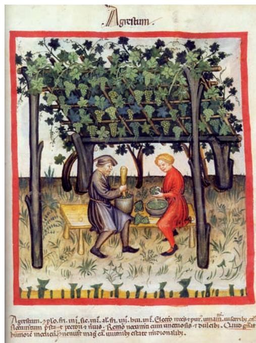
Abb. 1: Ernte und Verarbeitung der grünen Beeren „Agrestum“. Bilderhandschrift um 1390 (Cod. ser. nov. 2644, ÖNB, Wien)

Die Franzosen schaffen schon früh ihre eigene Version. Sie nennen ihn ver-jus (von jus vert , grüner Saft), wie in einer der frühen Handschriften des