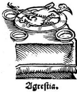
Abb. 2: Holzschnitt aus „Schachtafeln der Gesundheit“, Straßburg 1533. Symbolische Abbildung für die mit Agrest zubereiteten Speisen

Selbst aphrodisische Wirkungen wurden ihm zugeschrieben. Auch die Väter der antiken Medizinlehre Hippokrates (um 460- 370 v. Chr.) und Galen (129-200 n. Chr.) hatten sich ausführlich mit den gesundheitsförderlichen Eigenschaften dieses Saftes befasst und seine Verwendung als Würze und Lebensmittel in der Küche gefördert. Mit dem Niedergang des weströmischen Reiches und den chaotischen Zeiten der Völkerwanderung geht dieses Wissen jedoch nahezu verloren. Nur Bruchteile davon werden überliefert und gelangen über die Tradition der benediktinischen Klostermedizin, die sich der Vertreibung des „heidnischen“ Wissens durch die Klerikerkirche stets widersetzt hatte, ins Mittelalter. Das älteste deutsche Arzneibuch, das um 795 im Kloster Lorsch entstand, nennt in einer Liste von Arzneimitteln, die zur Grundausrüstung jeder Klosterapotheke gehören sollten, auch den Saft „Umfacio“. Dass damit