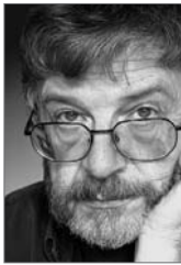
Text und Abbildungen: Elmar M. Lorey, Walluf

Was in Deutschland gerade wiederentdeckt wird, ist andernorts längst schon in vollem Gange. Winzer im Périgord und Bordelais stellen den "Verjus", den "grünen Saft", wie er dort genannt wird, wieder in nennenswerten Mengen her. Allein in der "Domaine du Siorac" im Bergerac, im Südwesten Frankreichs, sind es jährlich 250 Hektoliter, und einen guten Teil dieser kulinarischen Spezialität exportierte das Weingut bereits in den 1990er Jahren nach Nordeuropa, Japan, USA, Kanada und Australien. Denn nicht nur die gehobene französische Gastronomie hat die traditionsreiche Würze wiederentdeckt und feiert das regionale Produkt als Bereicherung ihrer Möglichkeiten. Selbst auf der anderen Seite des Globus, etwa in Malaysia freuen sich Köche über dieses europäische Traditionsgut und schätzen es als kulinarischen Gewinn. Auch in Österreich und der Schweiz haben sich längst schon die Nachahmer gefunden. Und seit die italienische Slow Food-Bewegung dem Thema 2005 besondere Aufmerksamkeit schenkte, wird auch in den nördlichen Weinbaure-